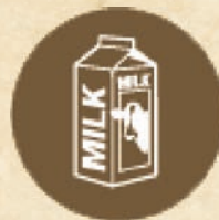
Мляко и млечни MILK