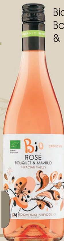
Bio Bouquet & Mavrud