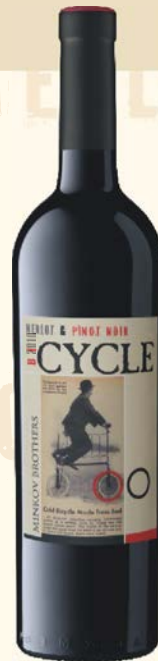
MERLOT & PINOT NOIR

Цвят: красив, интензивен рубинен цвят Аромат: доминиран от нюанси на зряла череша, с акценти на карамел и препечени тонове Вкус: сочен, със средна структура и дълъг финал с приятна свежест