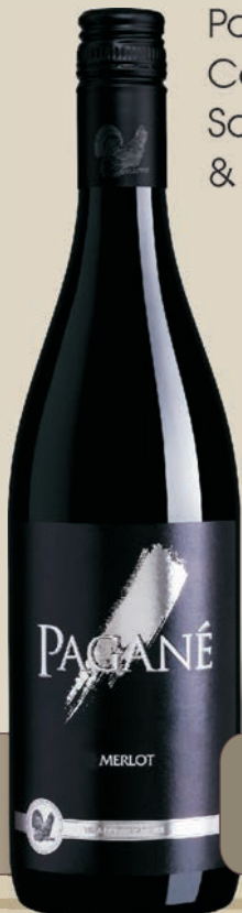
Pagane Cabernet Sauvignon & Merlot