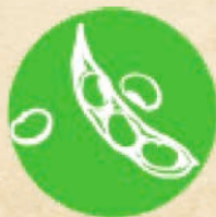
Соя и соеви продукти SOYA