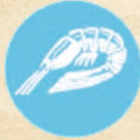
Ракообразни продукти от тях CRUSTACEANS