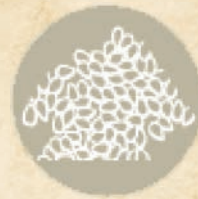
Сусам и продукти от него SESAME