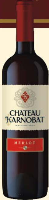
Chateau Karnobat MERLOT