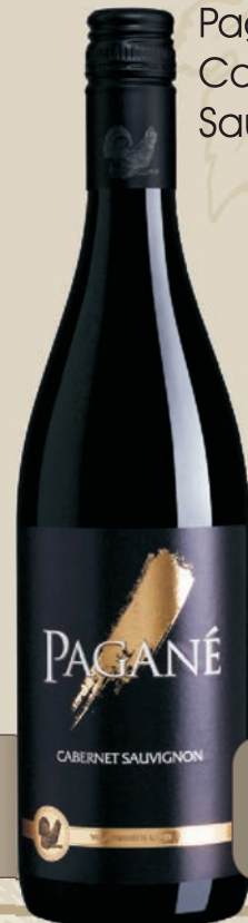
Pagane Cabernet Sauvignon