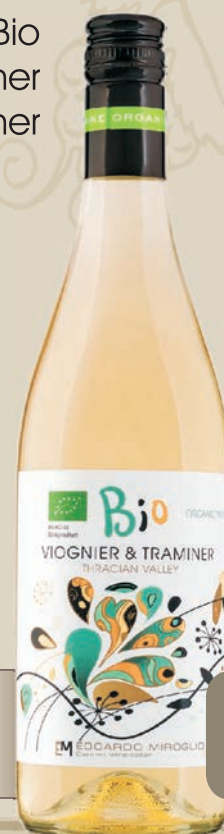
Bio Viogner Traminer