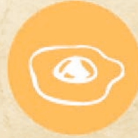
Яйца и продукти с тях EGGS