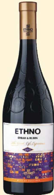
ETHNO Сира и Рубин

Притежава изразено плодов аромат с нюанси на черна череша и горски плодове, приятно комбинирани с акценти на черен шоколад.