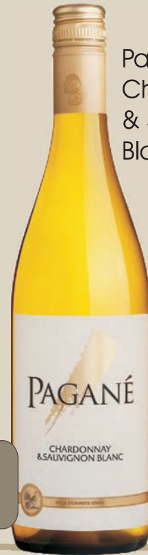
Pagane Chardonnay & Sauvignon Blanc