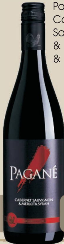
Pagane Cabernet Sauvignon & Merlot & Syrah