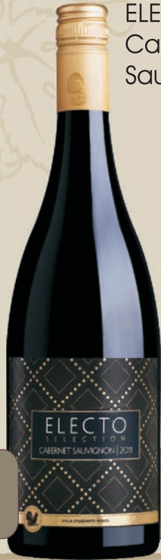
ELECTO Cabernet Sauvignon