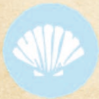
Мекотели и продукти от тях MOLLUSCS