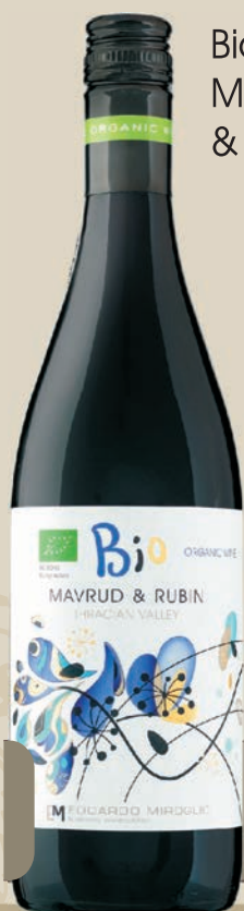
Bio Mavrud & Rubin