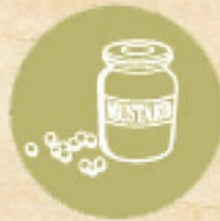
Синап и синапено семе (горчица) MUSTARD