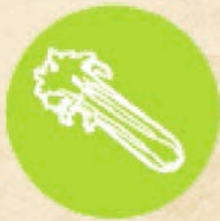
Целина и продукти от нея CELERY