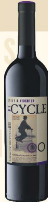
SYRAH & VIOGNIER