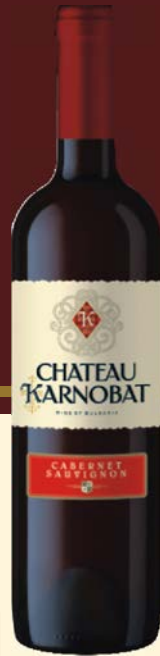
Chateau Karnobat CABERNET SAUVIGNON