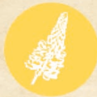
Лупина и продукти с нея LUPIN