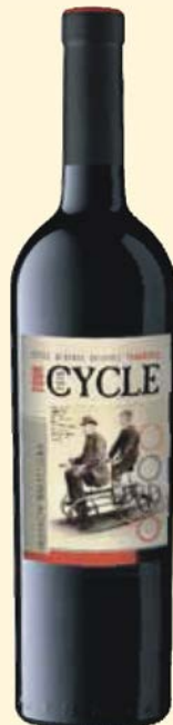
CABERNET SAUVIGNON & CABERNET FRANC & MERLOT

AWARDED the SILVER medal at the Mondial du Sauvignon 2013 France