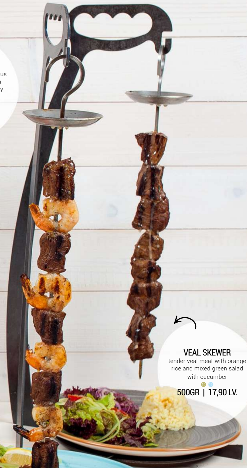
VEAL SKEWER tender veal meat with orange rice and mixed green salad with cucumber 500GR | 17,90 LV.