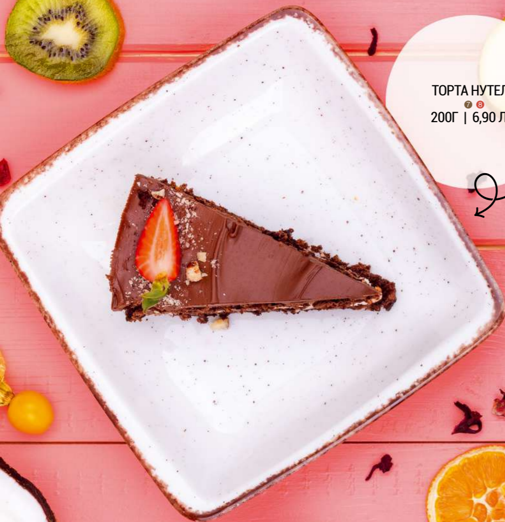
ТОРТА НУТЕЛА 200Г | 6,90 ЛВ.