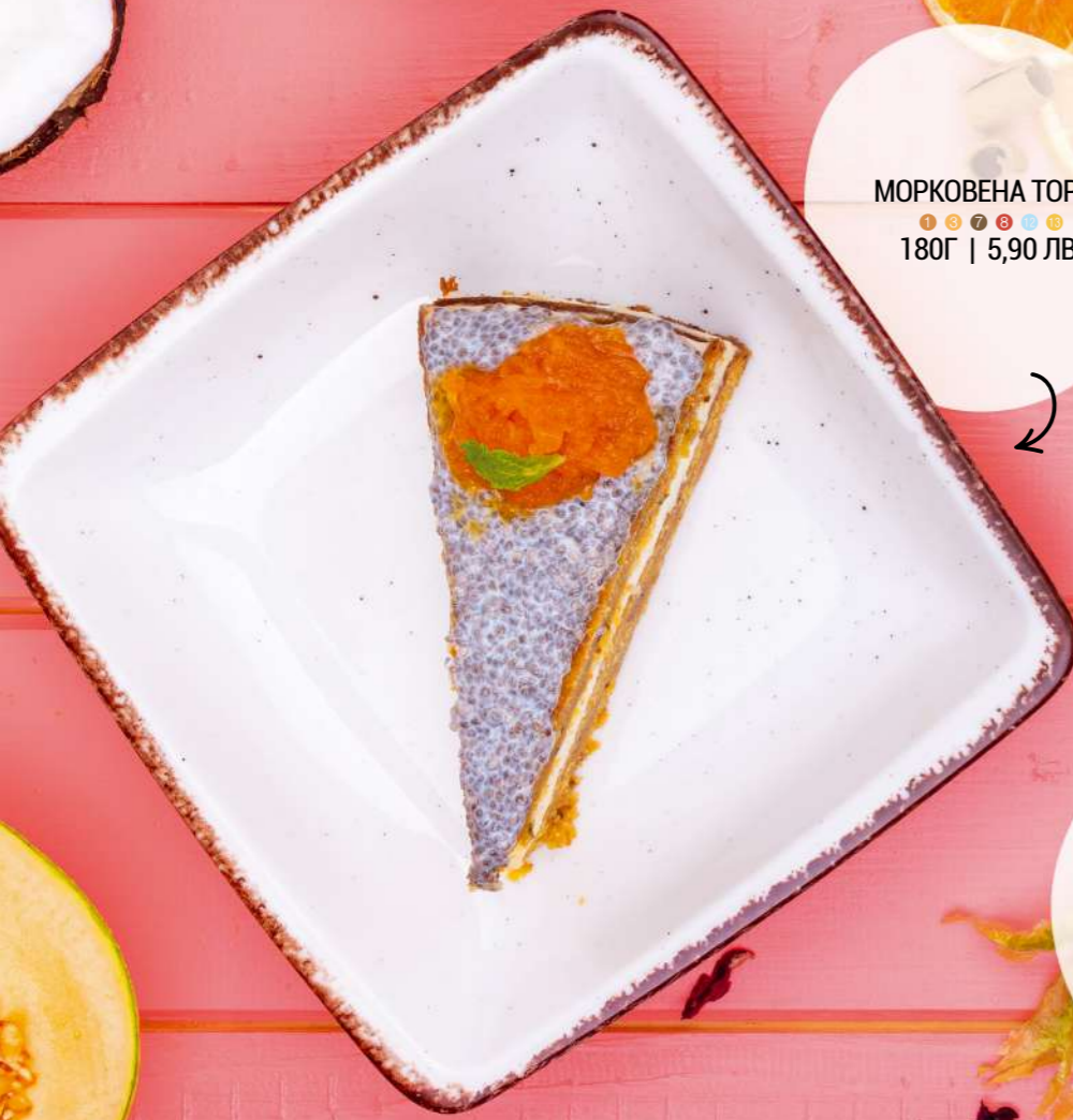
МОРКОВЕНА ТОРТА 180Г | 5,90 ЛВ.