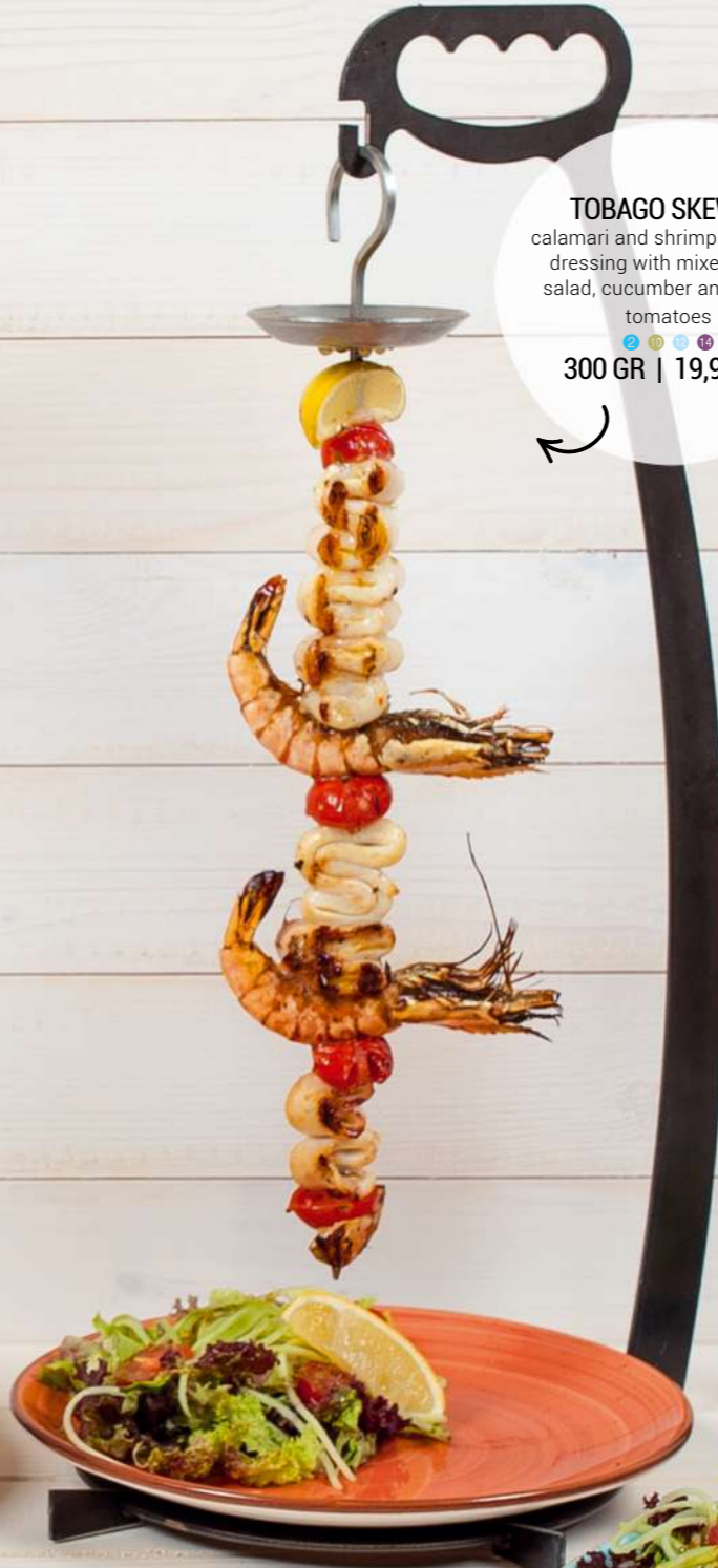
TOBAGO SKEWER calamari and shrimps in citrus dressing with mixed green salad, cucumber and cherry tomatoes 300 GR | 19,90 LV.