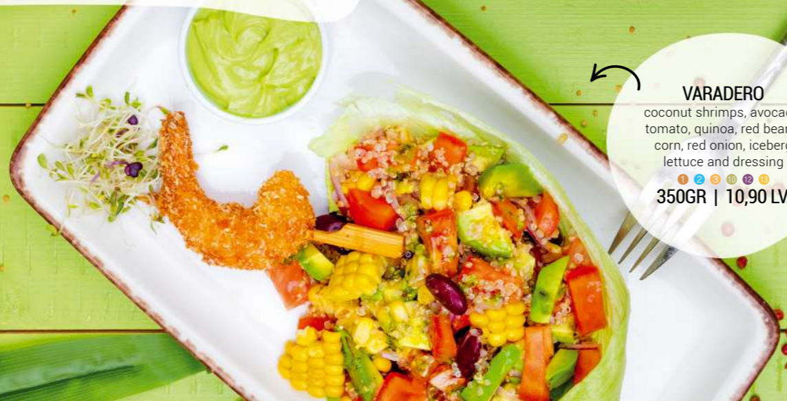
VARADERO coconut shrimps, avocado, tomato, quinoa, red beans, corn, red onion, iceberg lettuce and dressing 350GR | 10,90 LV.