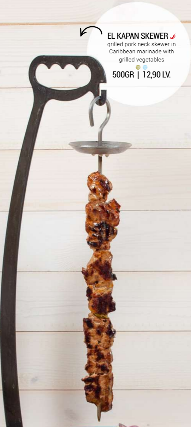
EL KAPAN SKEWER grilled pork neck skewer in Caribbean marinade with grilled vegetables 500GR | 12,90 LV.