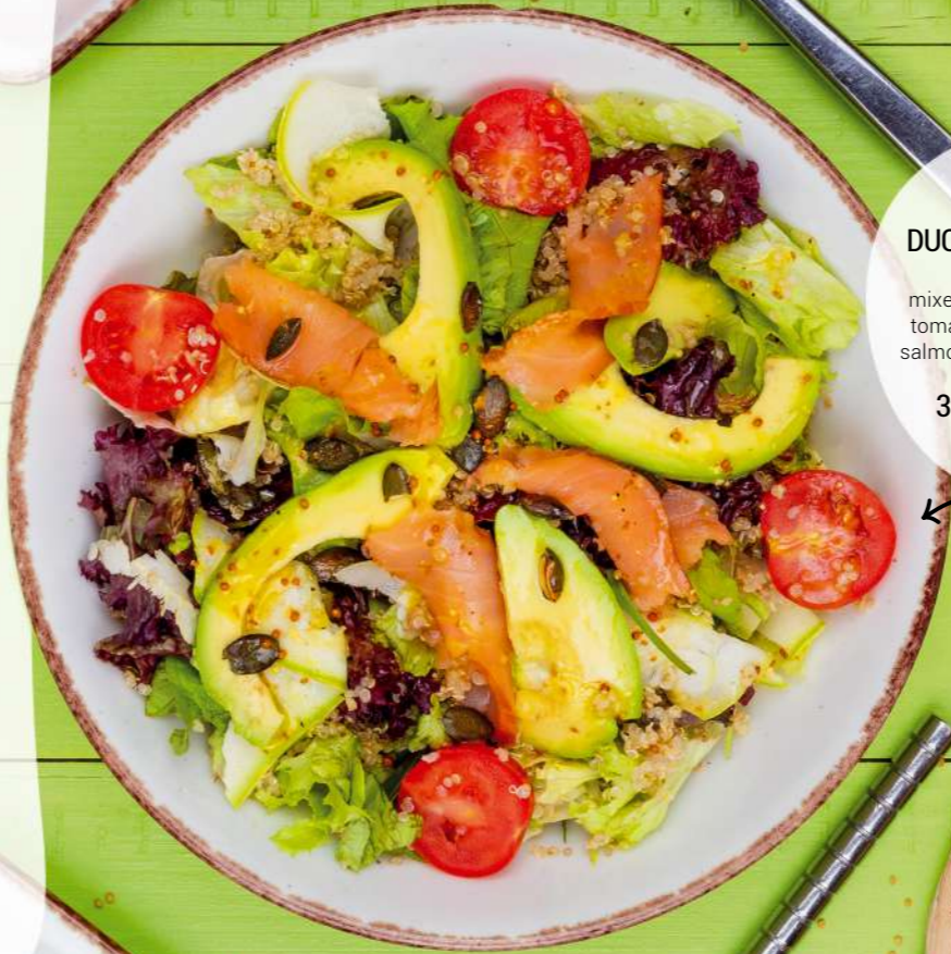
DUO SMOKED SALMON AND AVOCADO mixed salads, quinoa, cherry tomatoes, avocado, smoked salmon, zucchini and dressing 300GR | 10,90 LV.