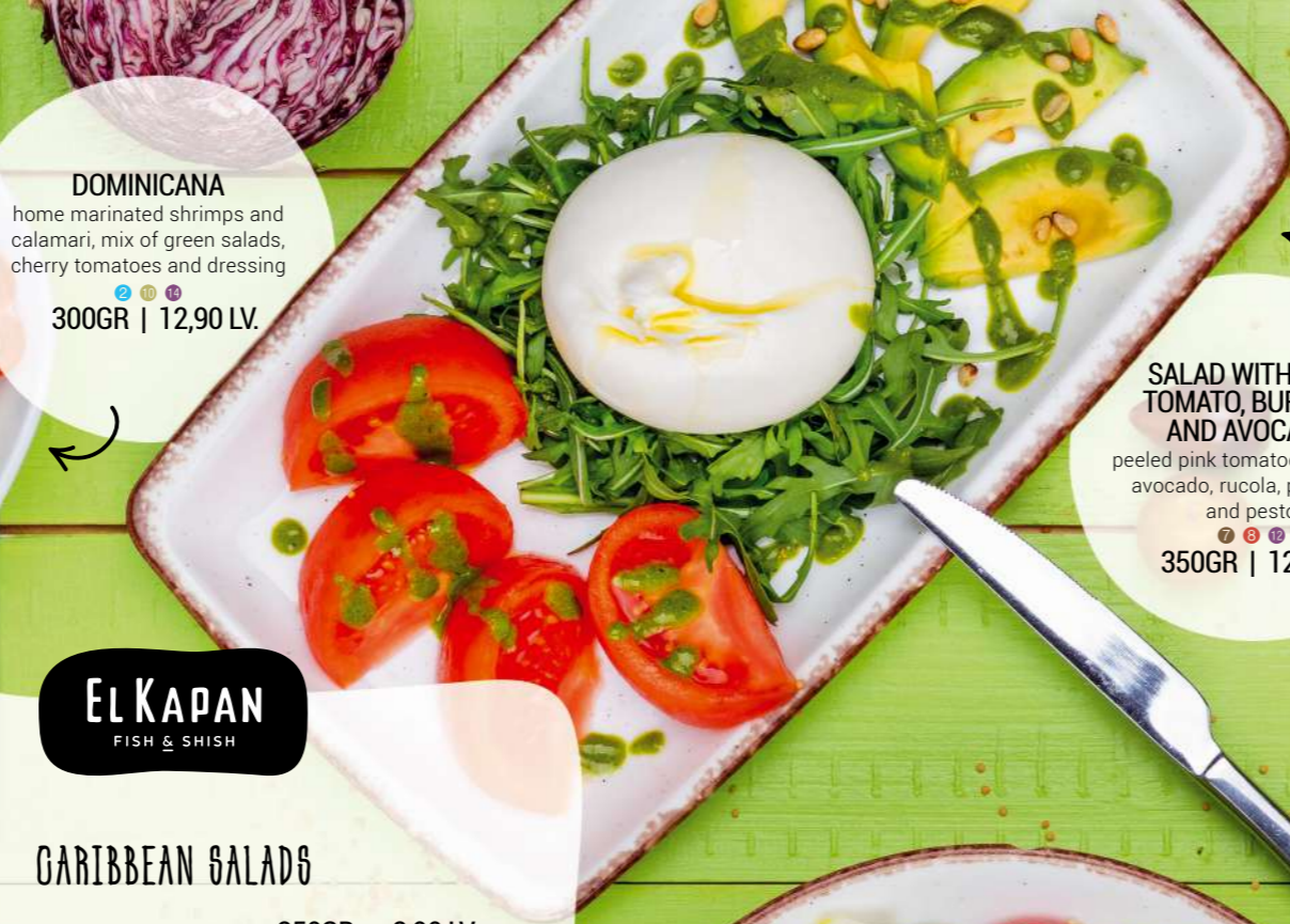
SALAD WITH PINK TOMATO, BURRATA AND AVOCADO peeled pink tomatoes, burrata, avocado, rucola, pine nuts and pesto 350GR | 12,90 LV.