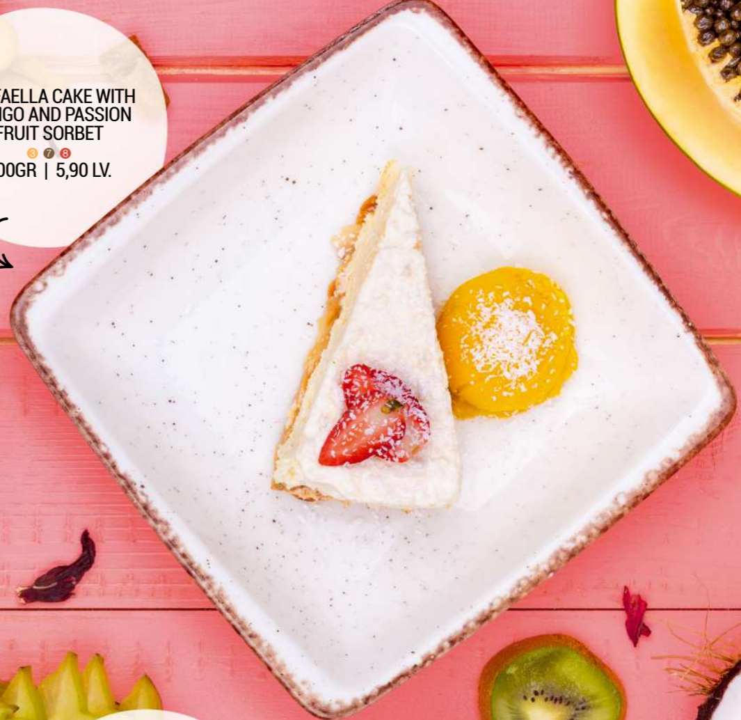
RAFFAELLA CAKE WITH MANGO AND PASSION FRUIT SORBET 200GR | 5,90 LV.