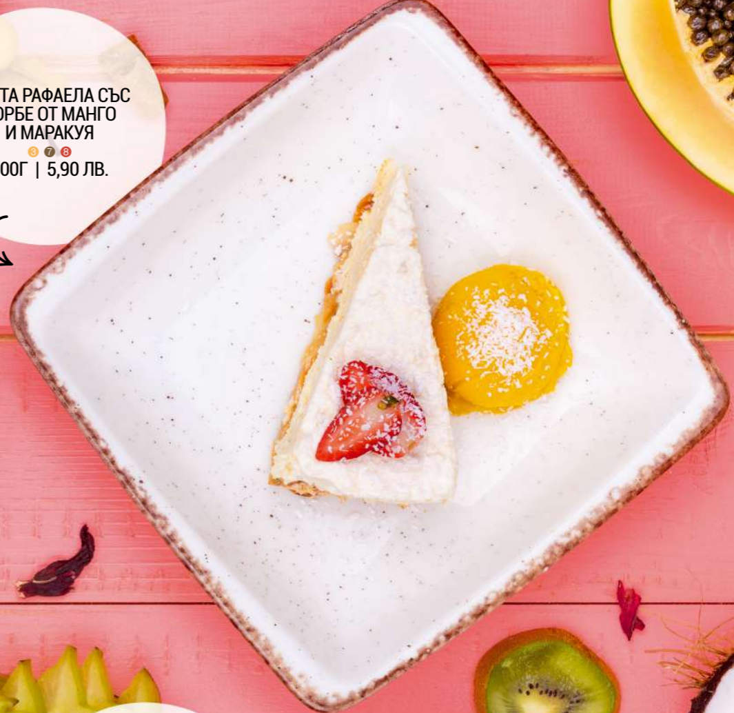
ТОРТА РАФАЕЛА СЪС СОРБЕ ОТ МАНГО И МАРАКУЯ 200Г | 5,90 ЛВ.