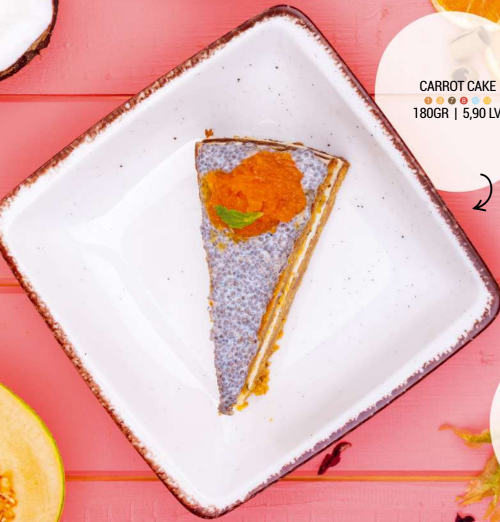
CARROT CAKE 180GR | 5,90 LV.