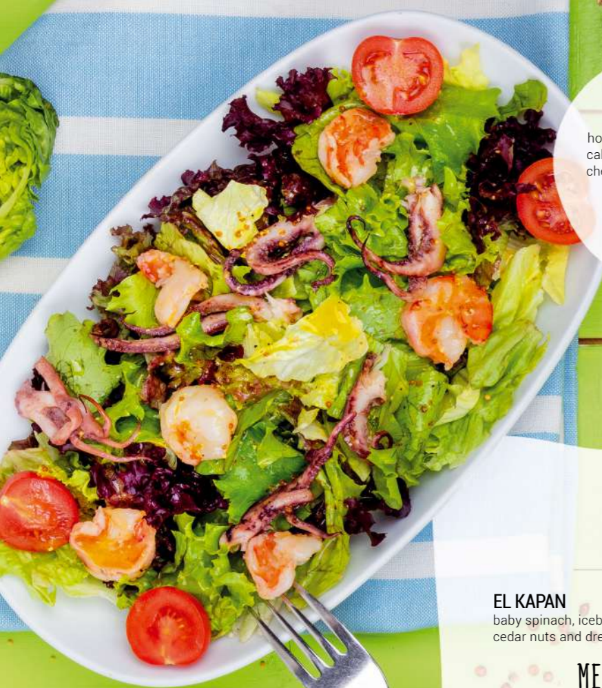
DOMINICANA home marinated shrimps and calamari, mix of green salads, cherry tomatoes and dressing 300GR | 12,90 LV.