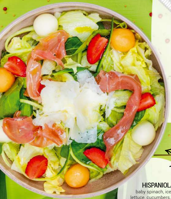
HISPANIOLA baby spinach, iceberg lettuce, cucumbers, melon, strawberries, jamon serrano, parmesan flakes and dressing 350GR | 12,90 LV.

NUMBER ONE 350GR 8,90 LV. peeled pink tomatoes, roasted pepper, marinated fresh cheese, kalamata olives