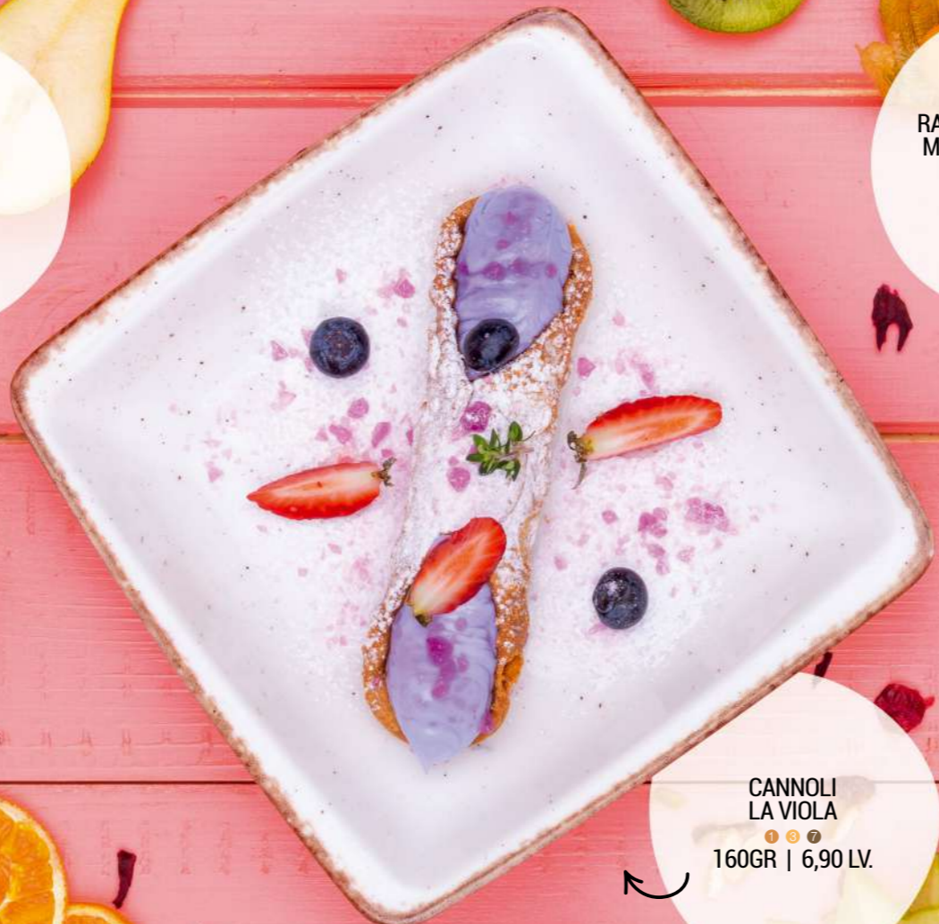
CANNOLI LA VIOLA 160GR | 6,90 LV.