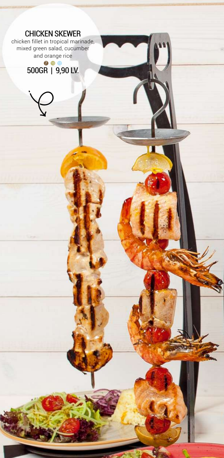
CHICKEN SKEWER chicken fillet in tropical marinade, mixed green salad, cucumber and orange rice 500GR | 9,90 LV.