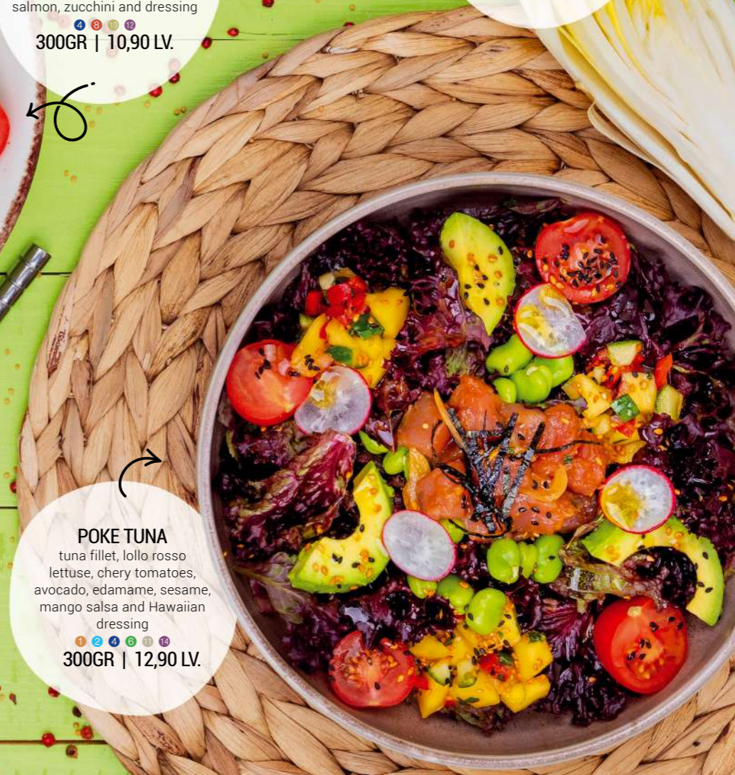
POKE TUNA tuna fillet, lollo rosso lettuce, chery tomatoes, avocado, edamame, sesame, mango salsa and Hawaiian dressing 300GR | 12,90 LV.