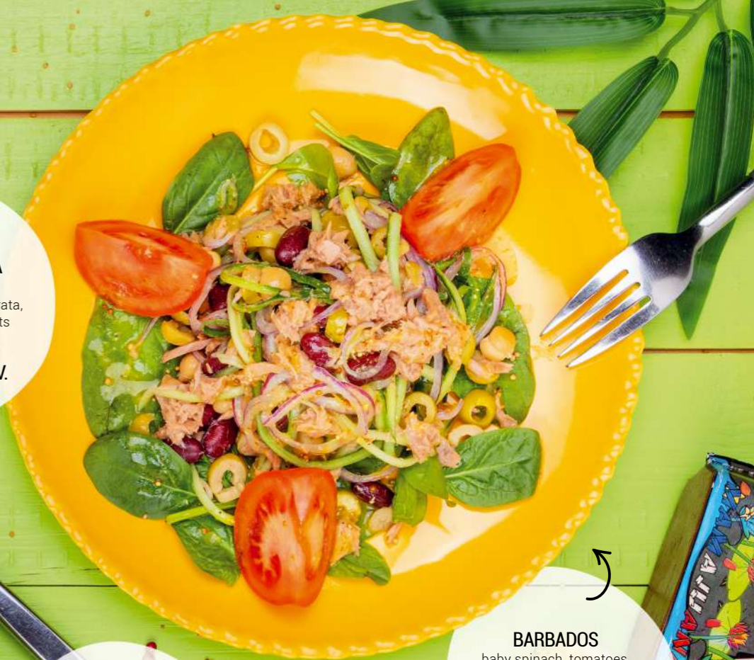
BARBADOS baby spinach, tomatoes, cucumber, tuna fish, red beans, chick peas, red onion, olives and dressing 350GR | 10,90 LV.