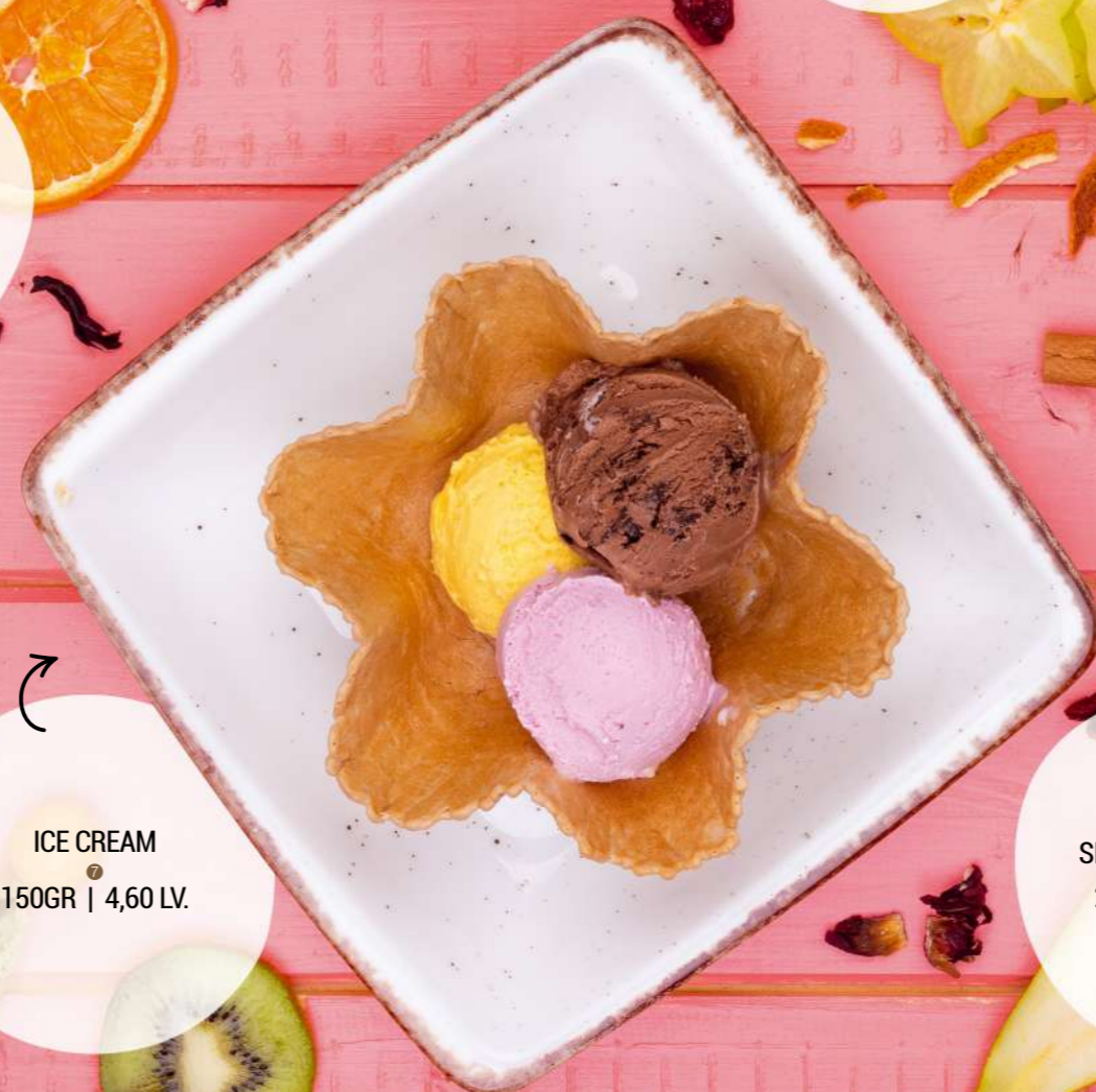
ICE CREAM 150GR | 4,60 LV.