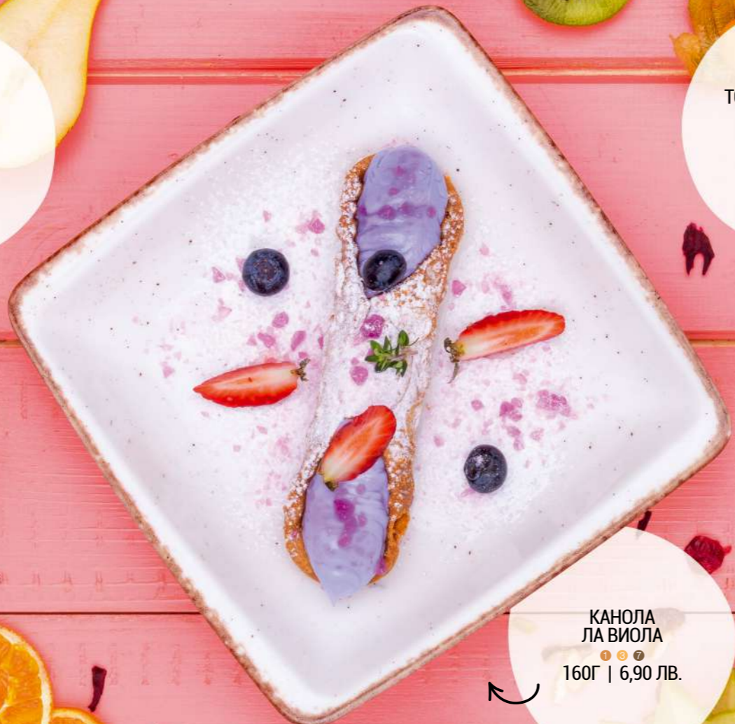
КАНОЛА ЛА ВИОЛА 160Г | 6,90 ЛВ.