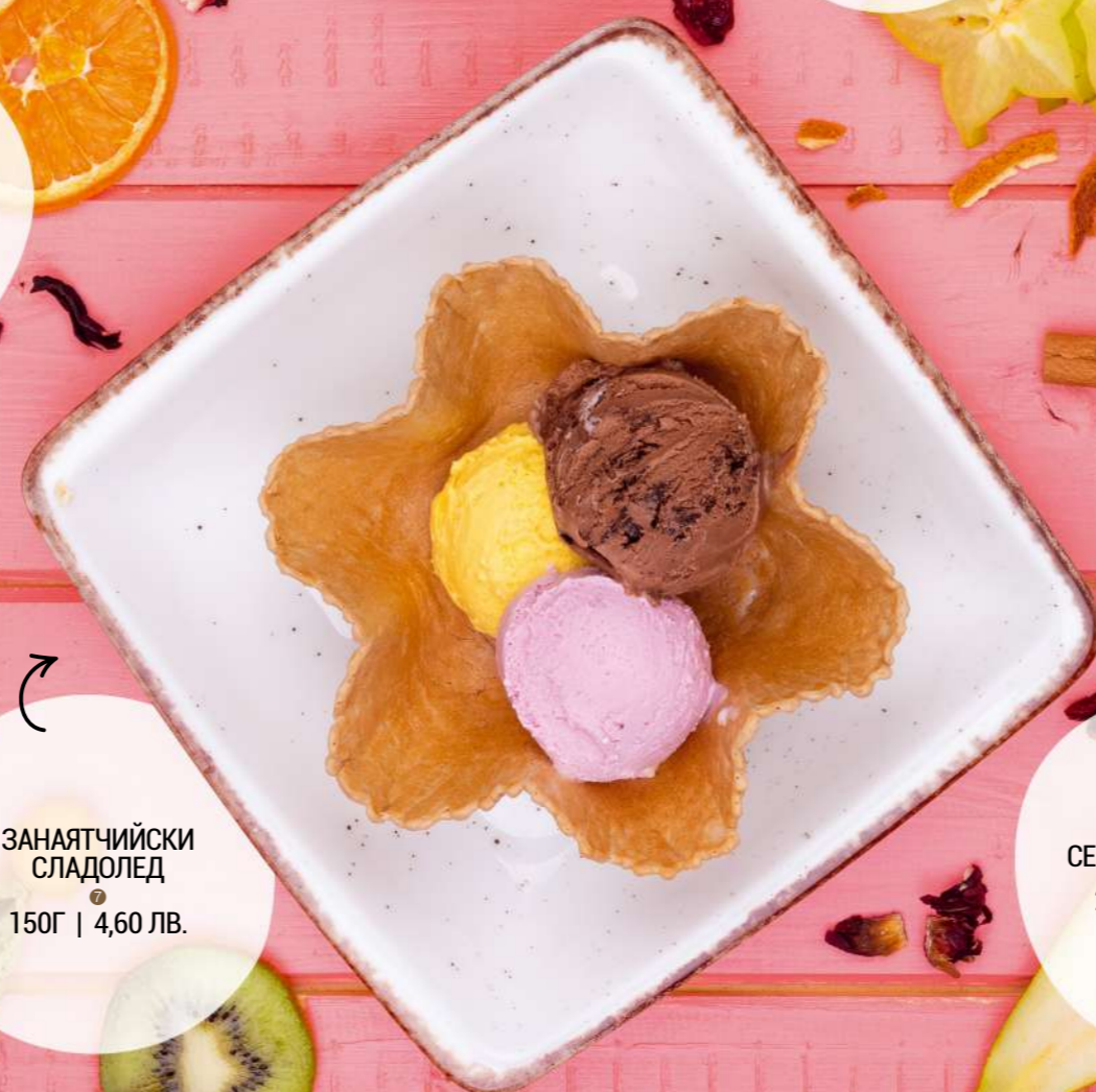
ЗАНАЯТЧИЙСКИ СЛАДОЛЕД 150Г | 4,60 ЛВ.