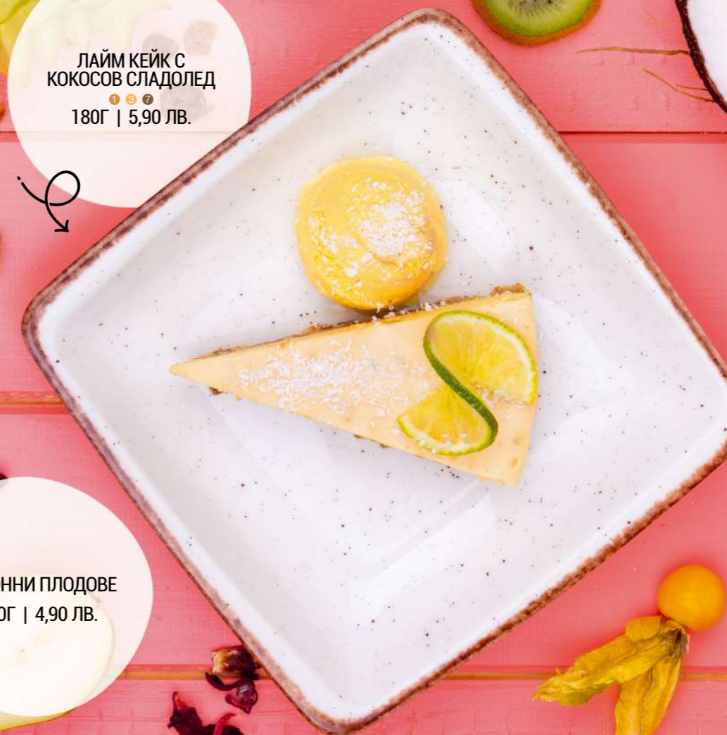
ЛАЙМ КЕЙК С КОКОСОВ СЛАДОЛЕД 180Г | 5,90 ЛВ.