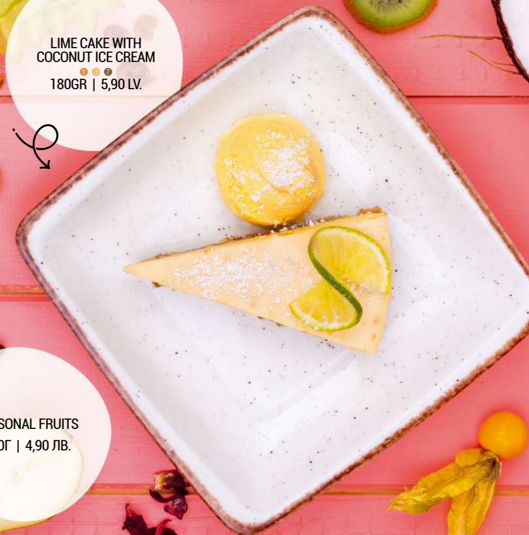
LIME CAKE WITH COCONUT ICE CREAM 180GR | 5,90 LV.