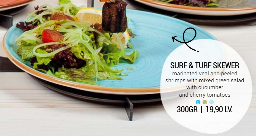
SURF & TURF SKEWER marinated veal and peeled shrimps with mixed green salad with cucumber and cherry tomatoes 300GR | 19,90 LV.