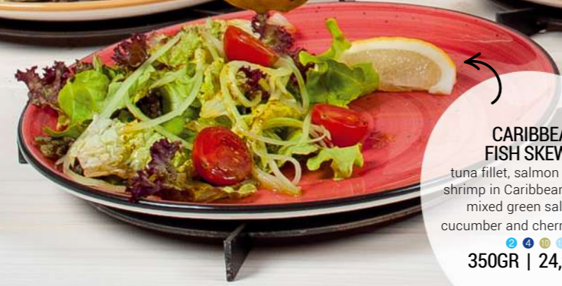
CARIBBEAN FISH SKEWER tuna fillet, salmon fillet, tiger shrimp in Caribbean marinade, mixed green salad with cucumber and cherry tomatoes 350GR | 24,90 LV.